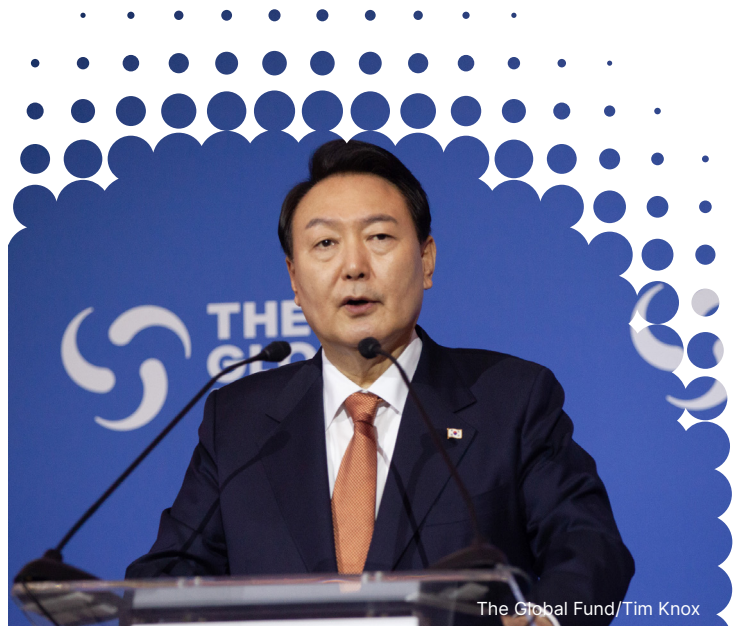
윤석열 대통령, 2022년 9월 21일 뉴욕에서 열린 글로벌펀드의 제7차 재정공약회의에서 한국으로는 전례 없는 규모인 1억 달러 기부 발표

한국은 글로벌펀드에 최대 보건의료물품 공급 국가 중 하나로, 2020~2022년 동안 약 5억 6,500만 달러 규모의 물품을 제공했습니다. 한국은 글로벌펀드에 최대 보건의료물품 공급 국가 중 하나로, 2020~2022년 동안 약 5억 6,500만 달러 규모의 물품을 제공했습니다. 한국에서 조달하는 보건의료물품의 82%는 한국 바이오메디컬 기업에서 생산하는 진단검사 제품들입니다.