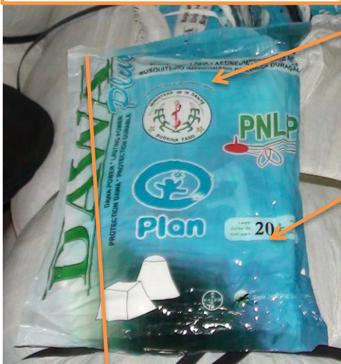
Emballage DAWAPlus contrefait

Un logo spécifique Burkina Faso est apposé sur les emballages contrefaits ; les emballages authentiques n'ont pas de logo