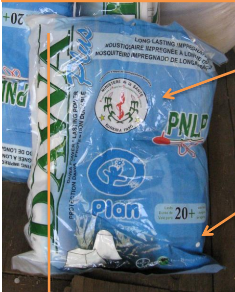
Emballage de moustiquaire DAWAPlus de contrefaçon

Un logo spécifique Burkina Faso est apposé sur les emballages contrefaits ; les emballages authentiques n'ont pas de logo