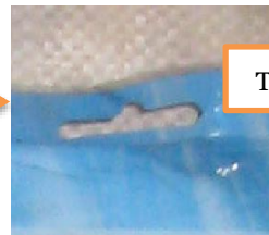
Trou de suspension

Les moustiquaires imprégnées d’insecticide DAWAPlus livrées au Burkina Faso étaient emballées dans des sacs présentant ces motifs, sans logo spécifique au Burkina Faso