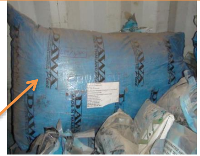
Emballage DAWAPlus authentique

Ballots de moustiquaires DAWAPlus de contrefaçon trouvés dans la région Centre-Nord (lot 4).