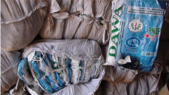
Ballots et emballages DAWAPlus de contrefaçon

Ballots de moustiquaires DAWAPlus de contrefaçon trouvés dans la région Centre-Nord (lot 4).