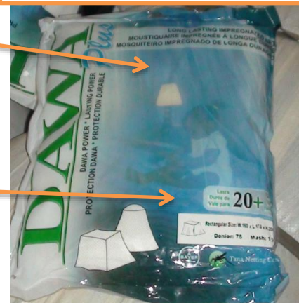
Emballage DAWAPlus authentique

Il n'y a pas de symbole de marque commerciale dans l'angle supérieur gauche des emballages contrefaits, alors qu'il y en a un sur les emballages DAWAPlus authentiques