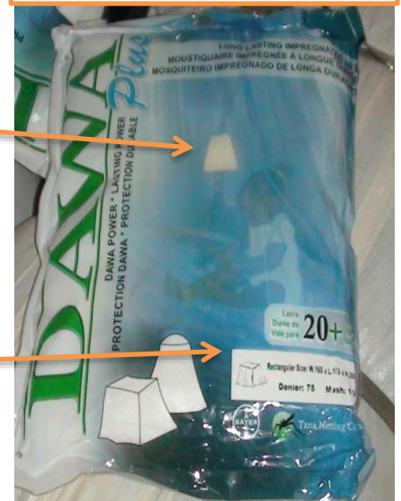
Emballage DAWAPlus authentique

L'emballage contrefait n'a pas d' étiquette blanche sur l'avant, indiquant les dimensions des moustiquaires