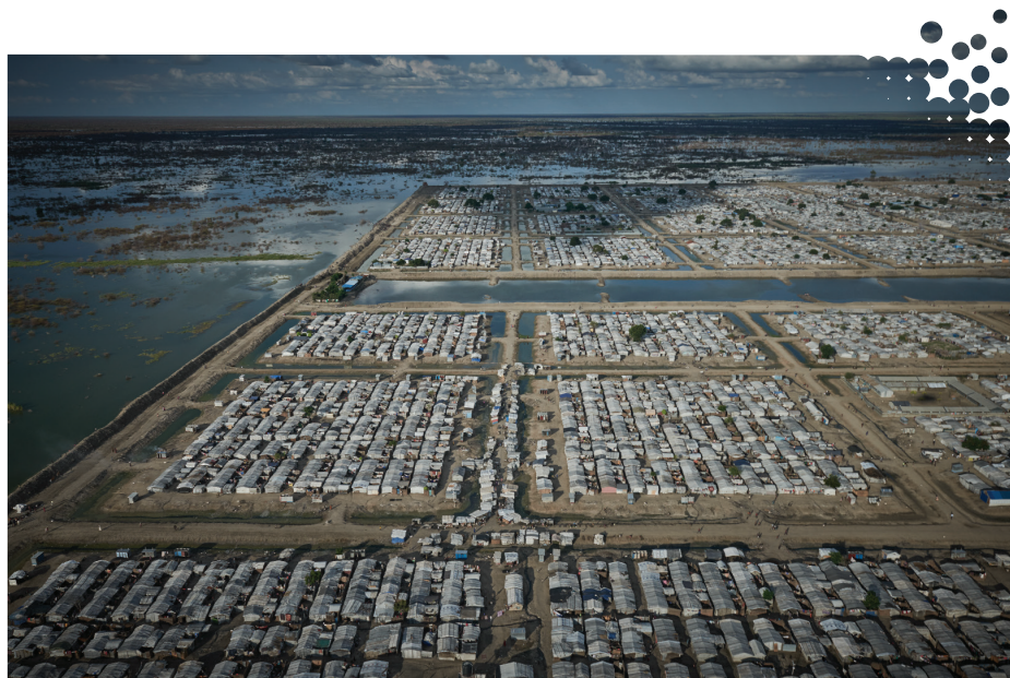
Una vista aerea degli sfollati interni a Bentiu, nel Sudan del Sud. Acque alluvionali circondano il campo dove vivono circa 120'000 persone. Gli argini di terra compatta sono l'unica barriera che protegge il campo dalle inondazioni. Il Global Fund sostiene i programmi per combattere l'HIV tra le popolazioni sfollate all'interno del Sudan del Sud che hanno trovato rifugio nei siti della Protezione civile.

Inoltre, investiamo per abbattere le barriere contro i diritti umani e le disuguaglianze di genere che ostacolano l'accesso ai servizi sanitari. Dobbiamo raddoppiare i nostri sforzi per sconfiggere l'AIDS, la tubercolosi e la malaria e costruire un mondo più sano ed equo.